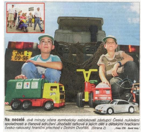
Na necelé dvě minuty včera symbolicky zablokovali zástupci České nukleární společnosti a členové sdružení Jihočeské tatkové a jejich děti s dětskými hračkami česko-rakouský hraniční přechod v Dolním Dvořišti. (Strana 2)

V červnu roku 2001 jsme spolu se sekci mladých z České nukleární společnosti (byl to jejich skvělý nápad!) a WINem (Ženy v jádře) pořádali v Dolním Dvořišti antiblokádu. Vzali jsme svoje děti, ty si vzaly plastová autíčka a motorky a na dvě minuty jsme zablokovali silnici, na protest proti blokádam rakouským.